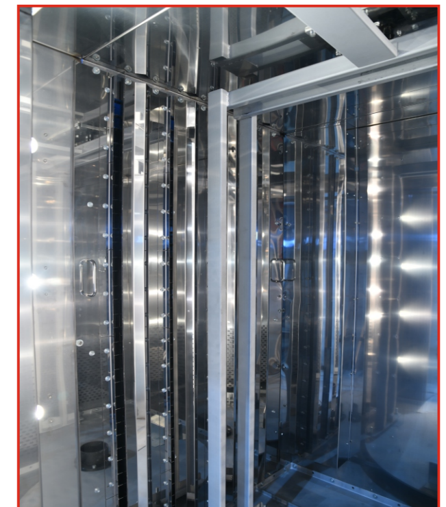
Пекарная камера ротационной печи «Муссон-ротатор» модель 250 МР Супер

• дверь пекарной камеры с двойным остеклением из термостойкого ударопрочного стекла. Внутреннее низкоэмиссионное стекло имеет высокие теплоотражающие свойства и позволяет снизить потери тепла. Уплотнение из силиконового резинового профиля исключает утечку паровоздушной смеси. Внешнее стекло открывается для облегчения санитарной обработки печи;