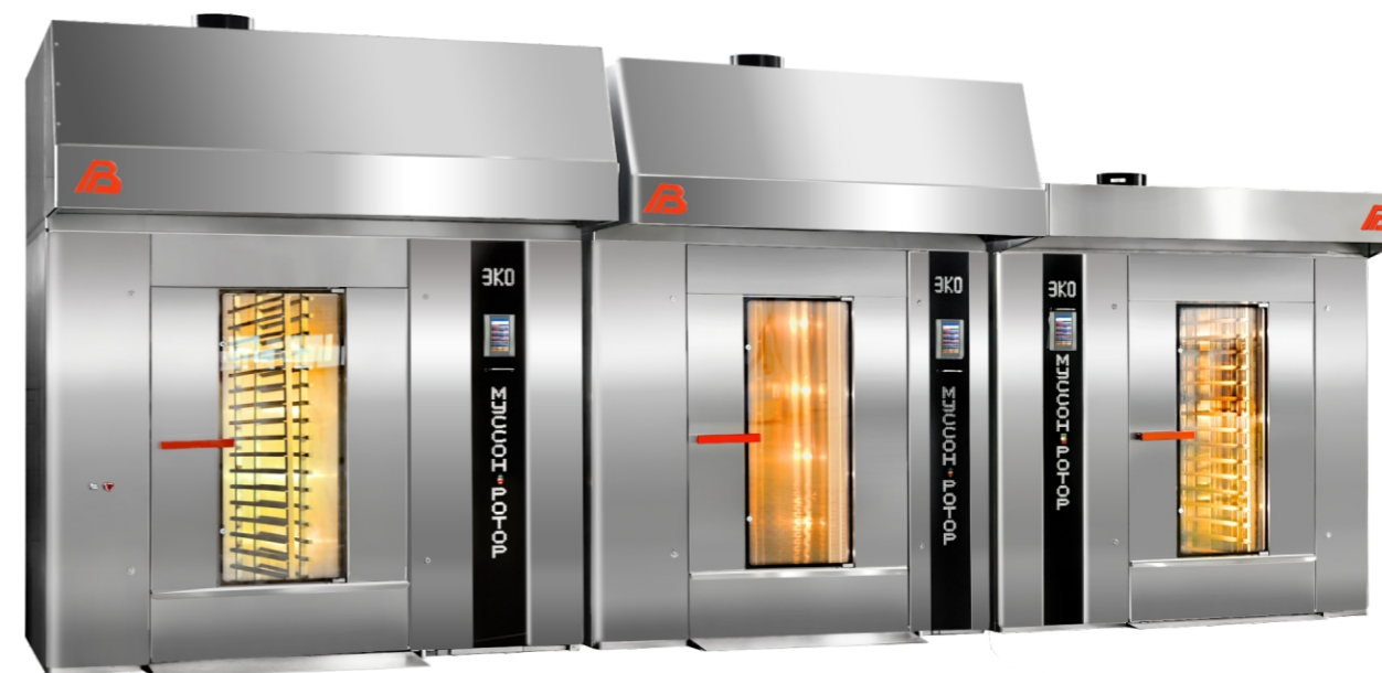
«Муссон-ротор» модель 350

Для повышения энергоэффективности и экологической безопасности печи при разработке был применен ряд инновационных решений, которые позволили приблизить КПД печей к теоретически достижимому максимуму. Внедрена инновационная трехходовая конструкция теплообменника с противотоком, где циркулирующий в печи поток воздуха движется от холодной зоны теплообменника к более горячей, максимально нагреваясь перед поступлением в пекарную камеру, оптимизирована схема движения отходящих газов.